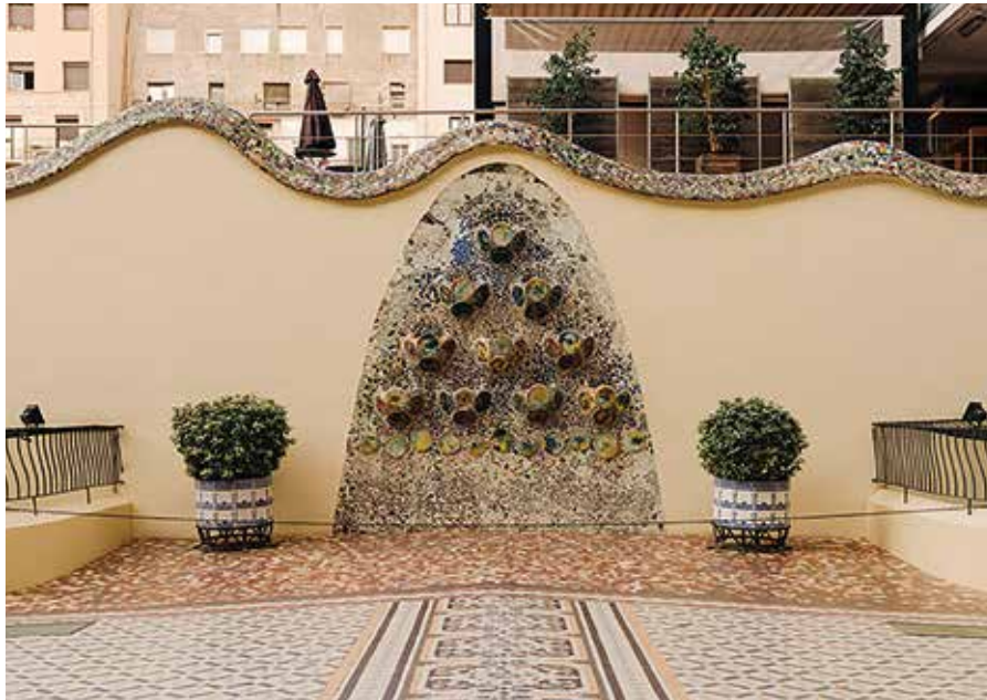
Dues imatges del resultat final del procés de restauració del jardí amagat i de la façana posterior de la Casa Batlló

La Casa Batlló, una de les obres més emblemàtiques de Gaudí, ha iniciat un nou capítol en el seu procés de restauració, centrant-se ara en la façana posterior de l'edifici i el seu pati, un espai que abans pertanyia exclusivament a la família Batlló. Aquesta restauració integral, la primera des de 1906, requereix una inversió considerable de 3,5 milions d'euros i s'estima que finalitzarà a la tardor de 2024.