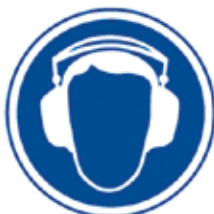
PROTECCIÓ OBLIGATÒRIA DE L'OÏDA