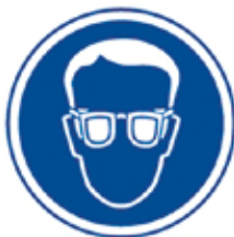
PROTECCIÓ OBLIGATÒRIA DE LA VISTA