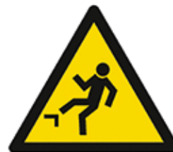
CAIGUDA A DIFERENT NIVELL