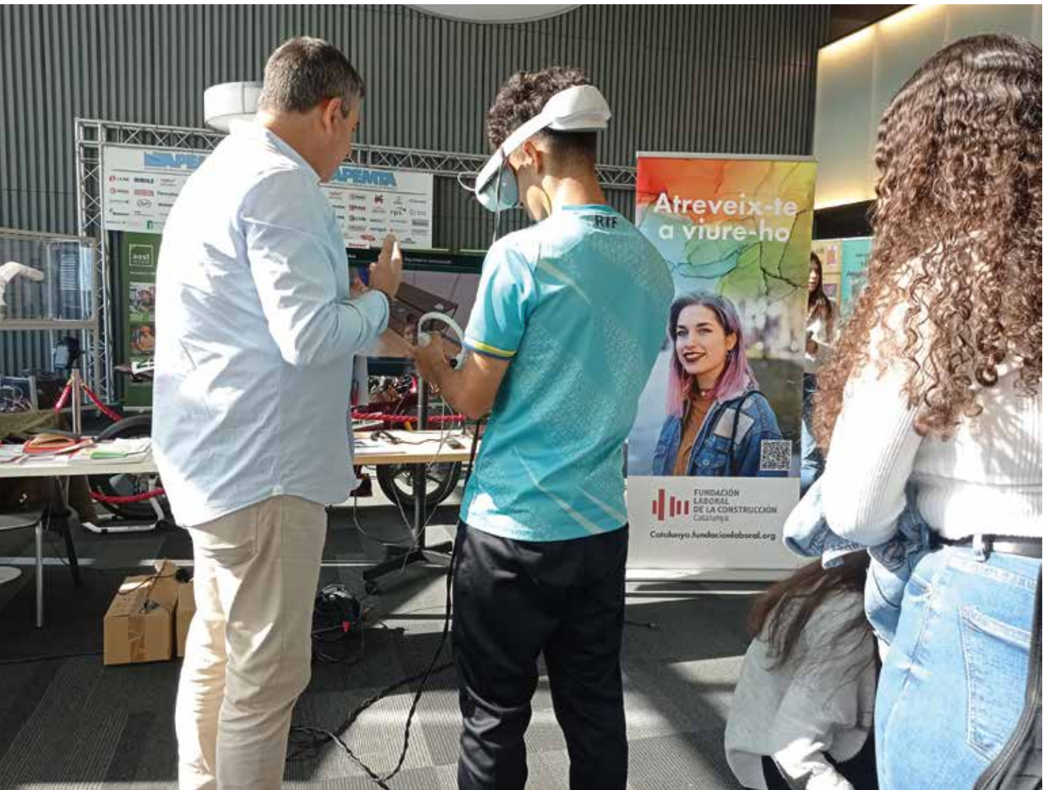
L'estand del sector de la construcció a la Fira Camins d'FP.

CNC-FOCONTA en col·laboració amb la Fundació Laboral han participat per segona vegada a la Fira de Camins FP Reus 2024