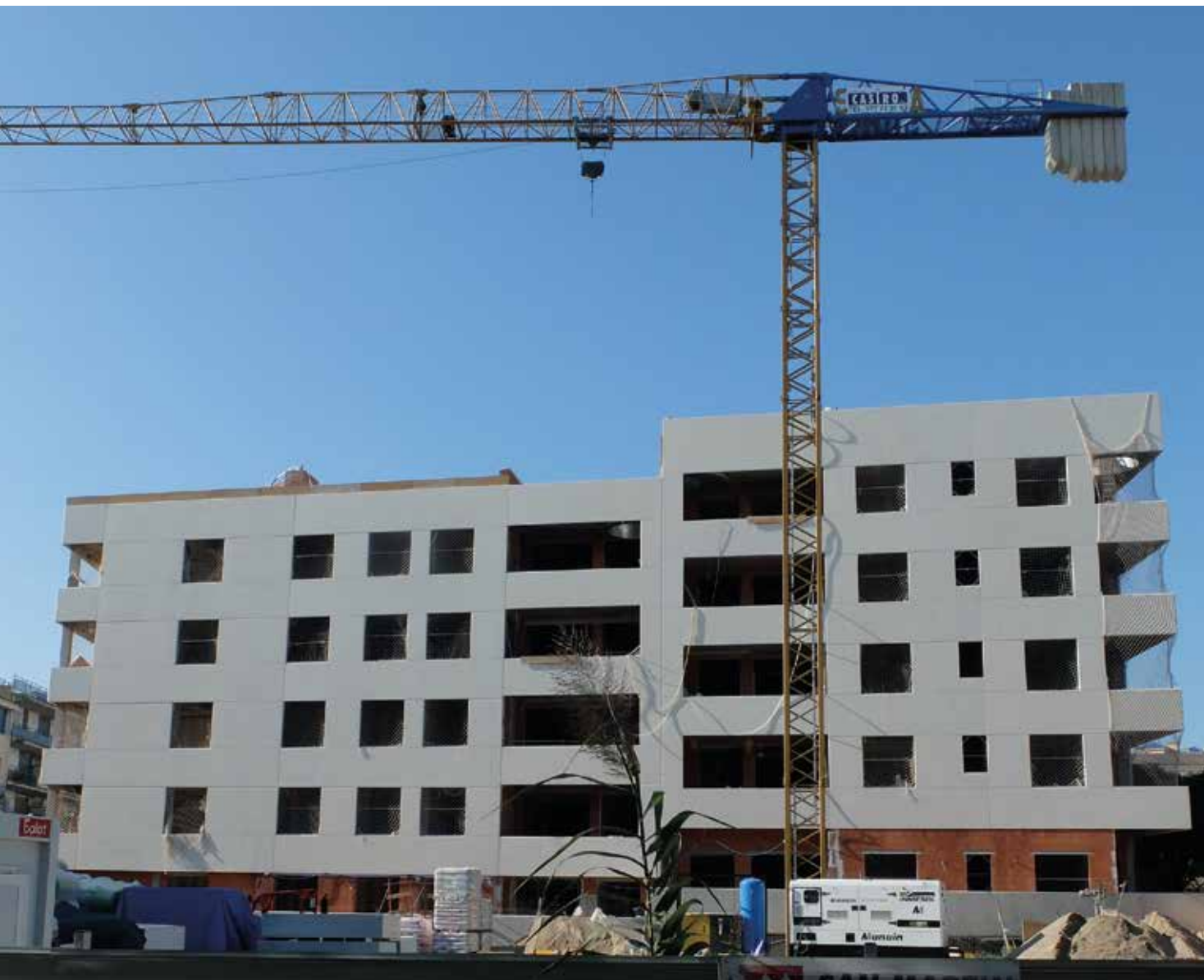
Edifici residencial en construcció a tocar de la Riera d'Alforja al centre de Cambrils.

Reus i el Baix Camp veuen una millora en la producció d'habitatge, però la compravenda d'habitatges usats continua dominant el mercat