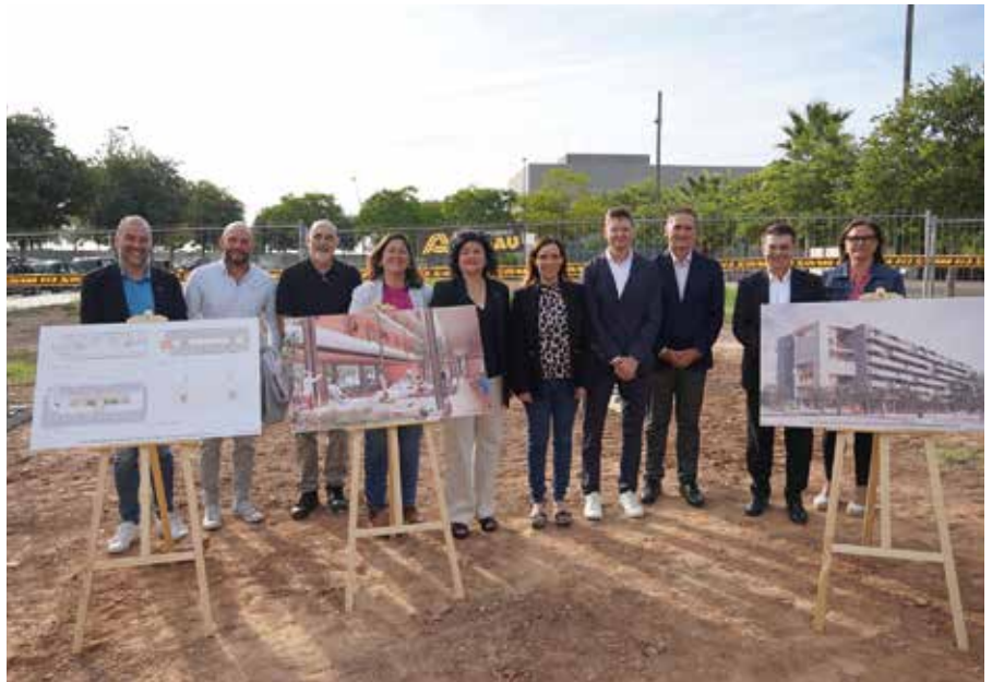
Col·locació de primera pedra de 132 nous habitatges de lloguer social a Mas Iglesias el passat mes de setembre

En conjunt, les llars que gaudeixen d'algun tipus de protecció, ja siguin de lloguer, de compra o de cessió d'ús, es quantifiquen en 116.196 a finals del 2023 –comptant només aquelles que han rebut aquesta qualificació a partir del 1993. Vuit de cada deu d'aquestes són de promotors privats o públics –a parts