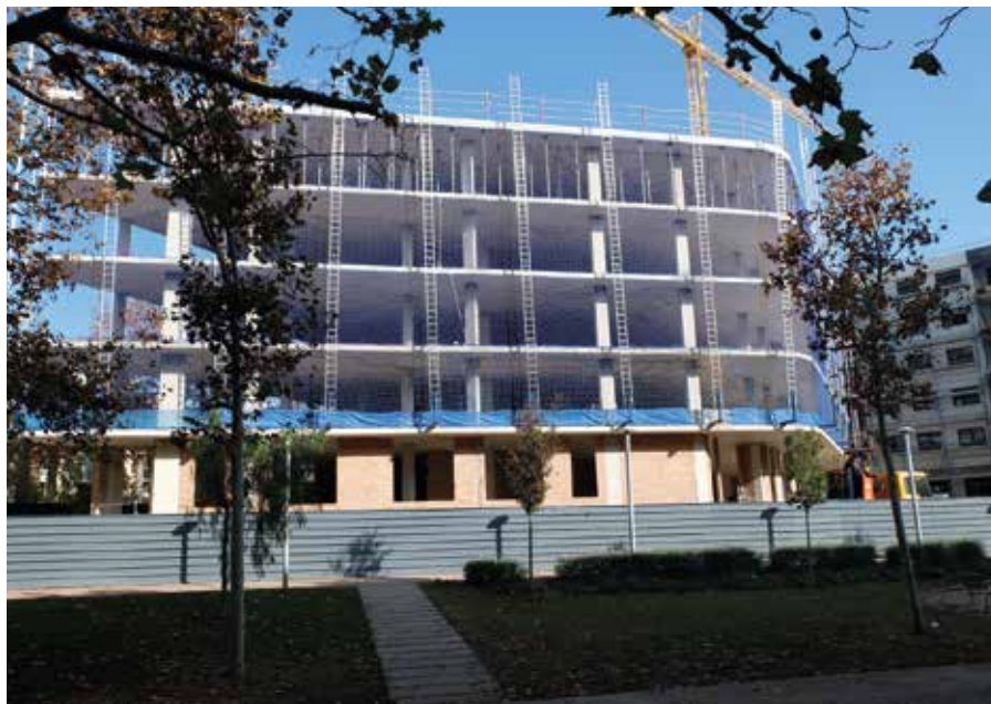
Bloc de pisos en construcció al centre de Cambrils

La caiguda reflecteix un tall generacional i una societat marcada per les herències i la desigualtat