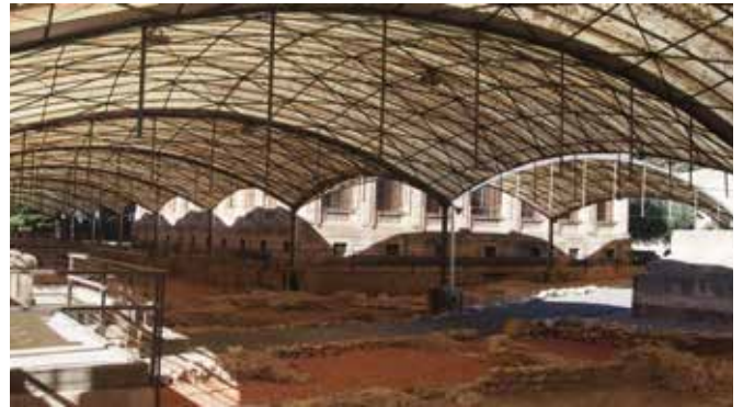
Dues imatges de la Necròpolis de Tarragona.

El Ministeri de Cultura ha tret a licitació les obres per a la rehabilitació integral de la Necròpolis de Tàrraco amb un pressupost de 5,3 milions d'euros, finançats amb fons europeus. Aquesta actuació suposarà una transformació global d'aquest espai, declarat Patrimoni de la Humanitat per la UNESCO, amb l'objectiu de preservar i posar en valor en dels jaciments més importants del llegat romà a Tarragona.