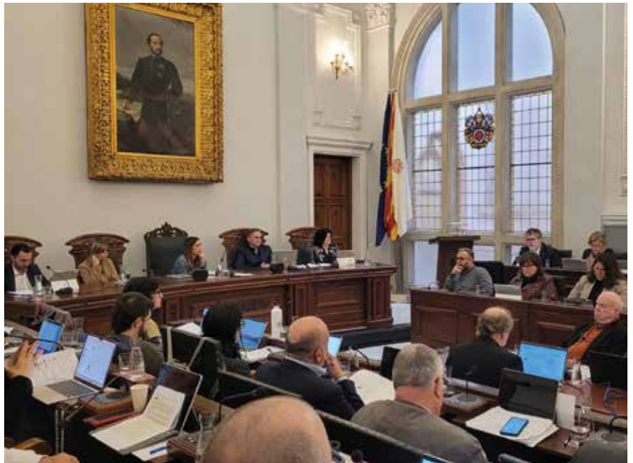
Imatge del ple del passat 15 de novembre en el qual es va aprovar provisionalment el pressupost pel 2025

El pressupost 2025 preveu un Pla d'Inversions de 22,33 milions d'euros per tot el grup ajuntament, dels quals 14,4 milions corresponen directament de l'Ajuntament i els 7,9 milions restants corresponen a les empreses municipals i als organismes autònoms. L'Ajuntament manté per segon any consecutiu l'esforç inversor sense incrementar el deute.