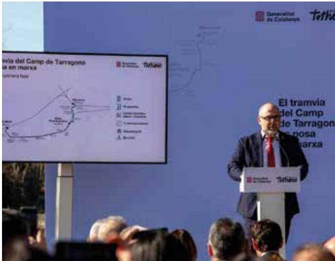
L'alcalde de Cambrils, Alfredo Clua, durant la presentació de la primera fase del projecte del tramvia entre Cambrils i Salou.

La primera fase del projecte, que comprèn el traçat entre Cambrils Centre i Vila-seca Universitat, començarà aquest mateix estiu