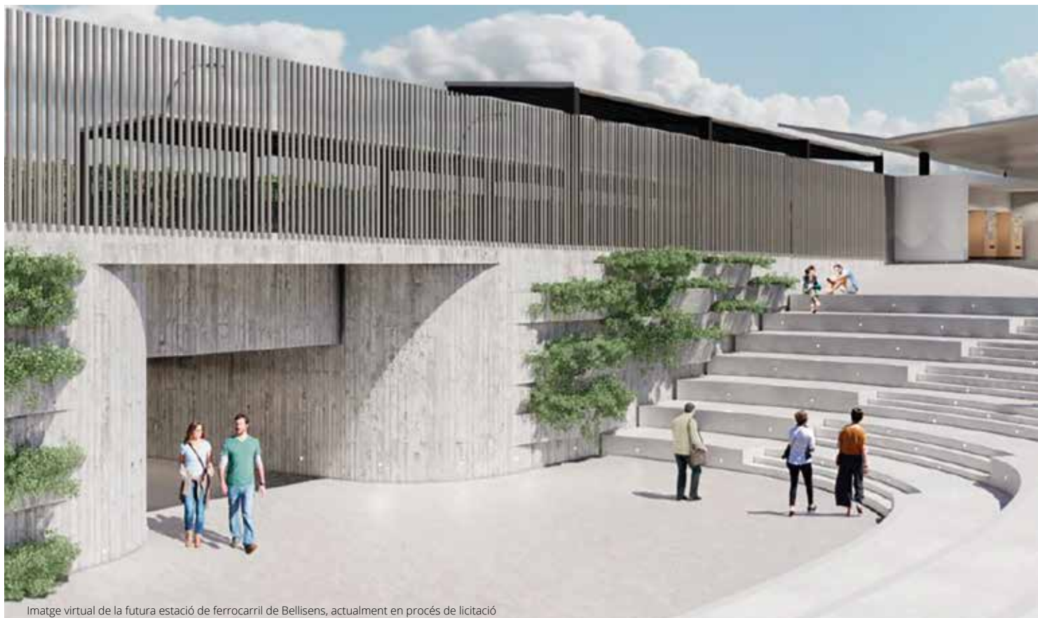
Imatge virtual de la futura estació de ferrocarril de Bellisens, actualment en procés de licitació

Destaca la licitació al segon trimestre de l'Hospital Joan XXIII de Tarragona per 206 milions d'euros, que ha fet incrementar en un 92% les dades de Tarragona