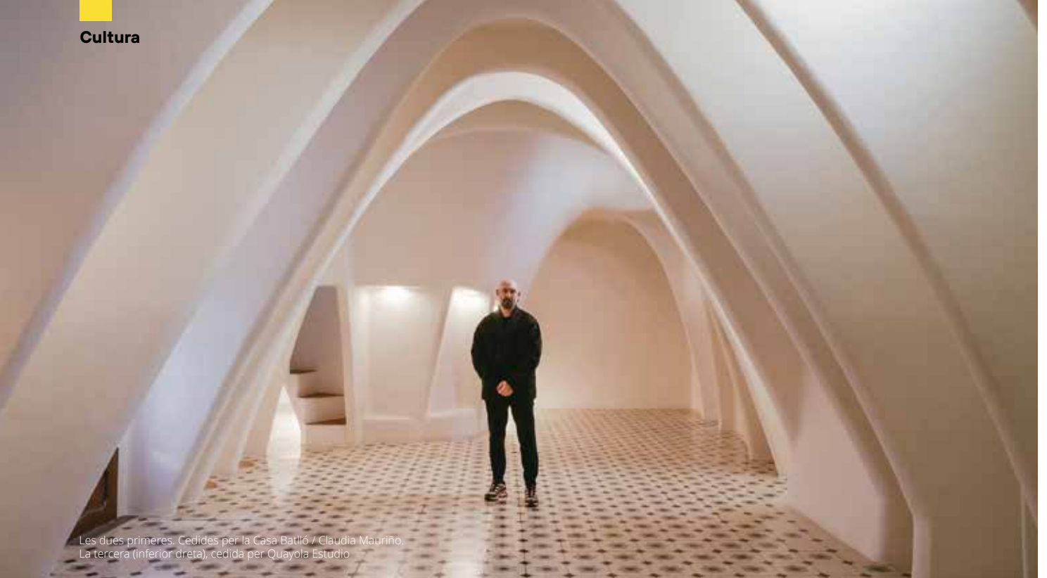
Les dues primeres. La tercera (inferior dreta)